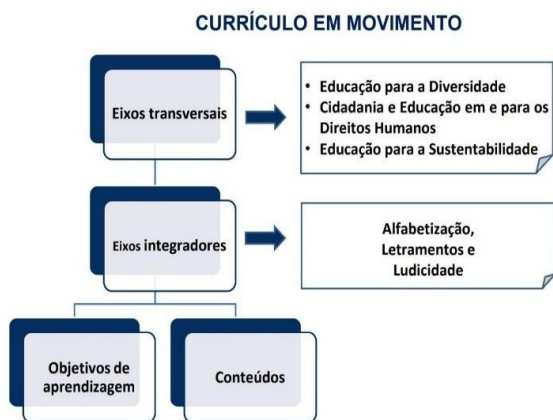
Figura 1 - Organização do Currículo em Movimento

Da tentativa de definição, depreende-se que o Currículo em Movimento prioriza uma ideia de educação cuja compreensão vai além da transmissão sistematizada de conteúdos. Nessa perspectiva curricular, os conteúdos não são pensados e organizados de modo isolado das condições individuais e sociais dos seres que os recebem. Tão importante quanto pensar e organizar os conteúdos é fazer com que eles sejam significativos para aqueles que, além de os receberem, devem, com eles, interagir. No âmbito desta orientação, o currículo necessita ser concebido como forma de dialogar criticamente com as vidas que chegam à escola e que, ao mesmo tempo, extrapolam os seus muros. Os responsáveis pela prática pedagógica em âmbito escolar devem, portanto, olhar para o educando procurando enxergá-lo como um ser integral, preñado de histórias, de culturas, de sentimentos e de particularidades individuais.