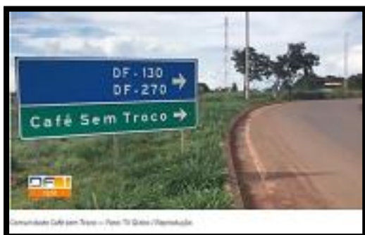
Figura 2 Acervo da Escola