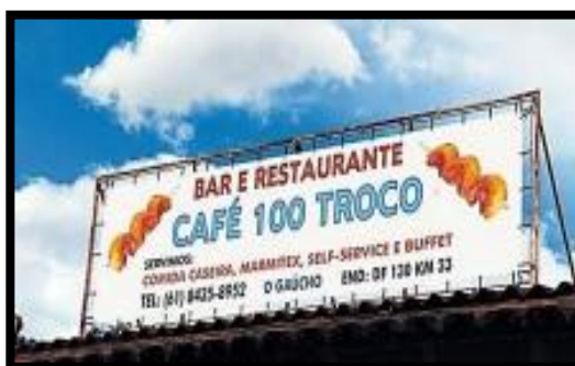
figura 3 Acervo da escola