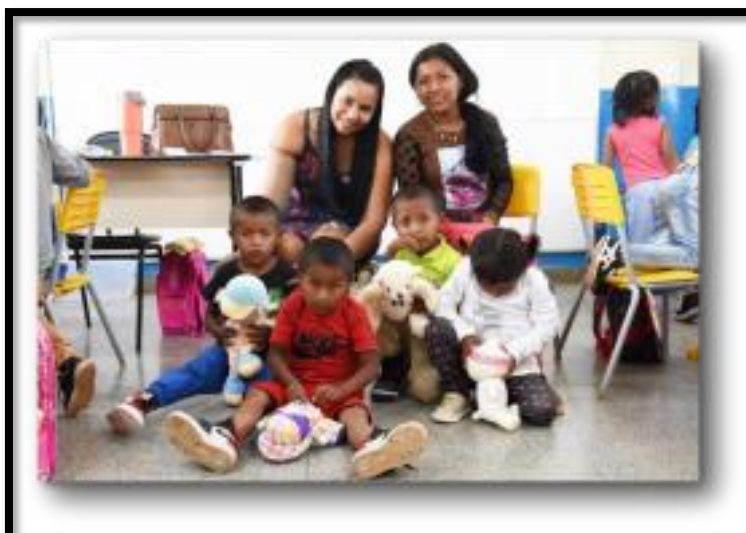
Os alunos acolhidos têm entre 4 e 17 anos e estavam sem acesso à alfabetização Na foto, a professora e a Educadora Social.

“De portas abertas para a inclusão. O ano letivo na Escola Classe Café sem Troco, localizada na zona rural do Paranoá, começou de forma especial. A escola se solidarizou e acolhe, desde o primeiro dia de aula, 33 crianças e adolescentes indígenas refugiados da Venezuela. Os alunos fazem parte da Comunidade Indígena Warao Coromoto, que atualmente encontra-se a 4km da escola. Eles têm entre 4 e 17 anos e estavam sem acesso à alfabetização. O desafio da escola agora é incluí-los na sociedade por meio da aprendizagem e convívio escolar.