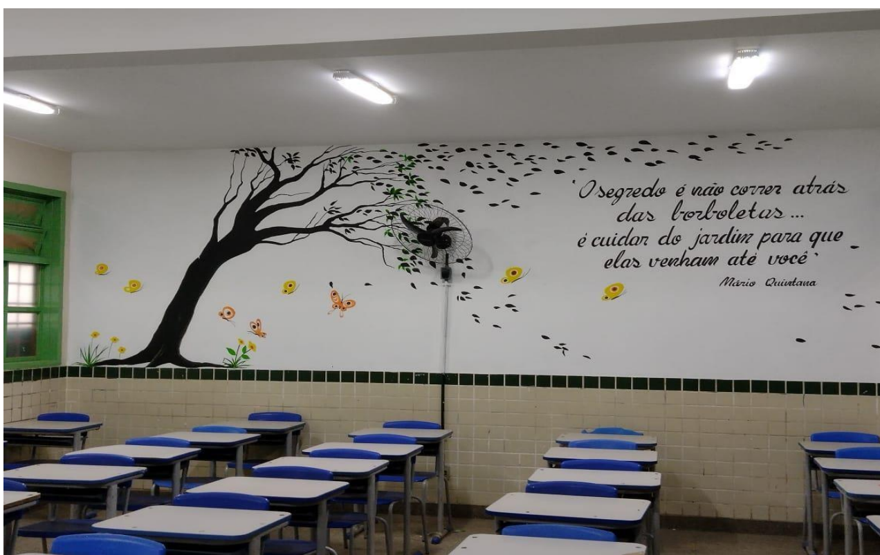
Sala de Aula