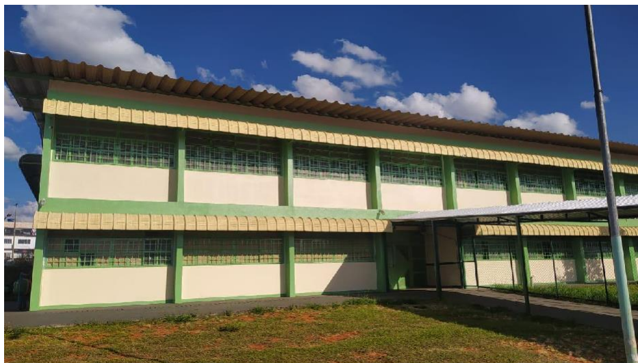
Lateral do Prédio