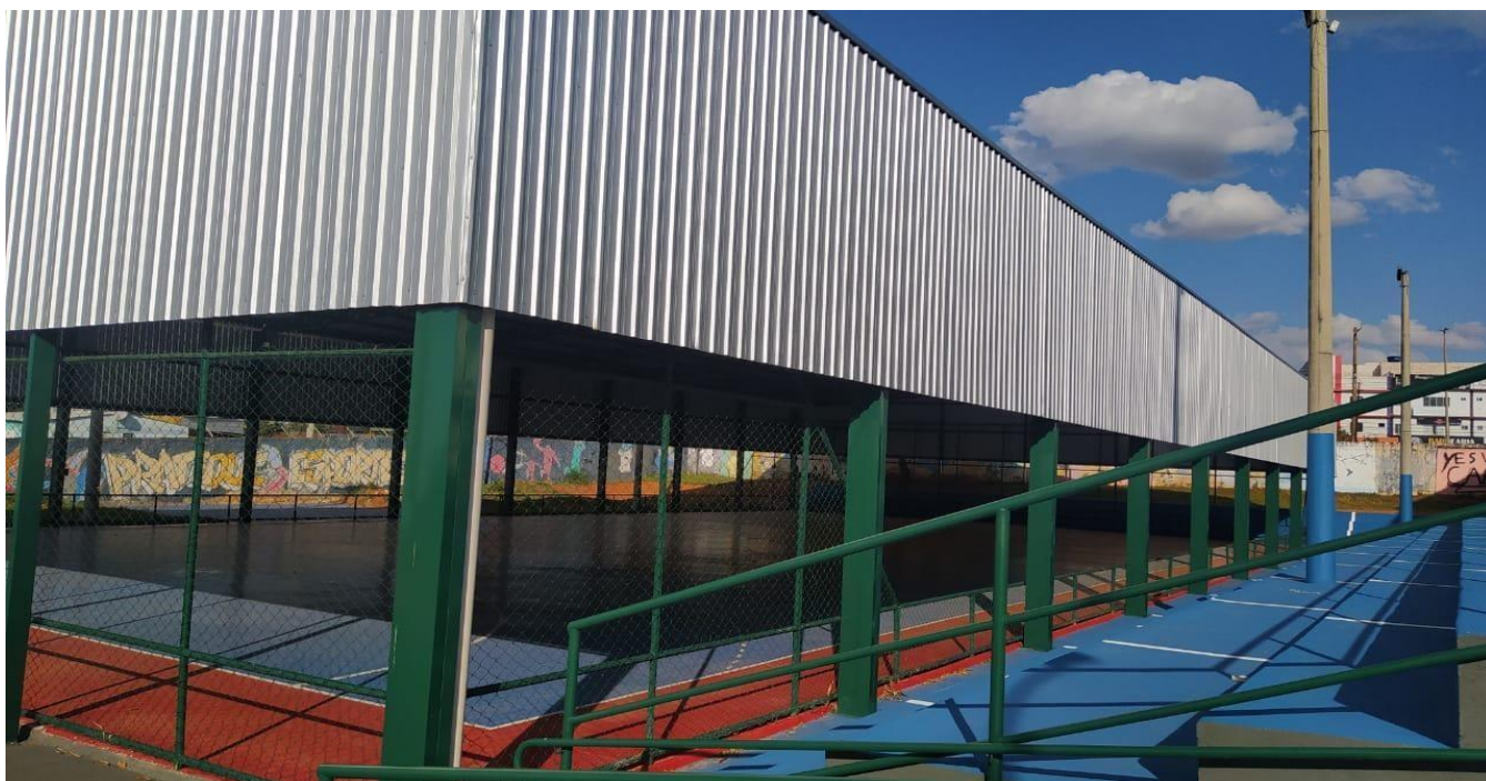
Quadra de esportes