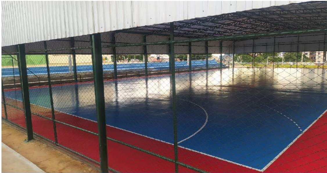
Quadra de esportes