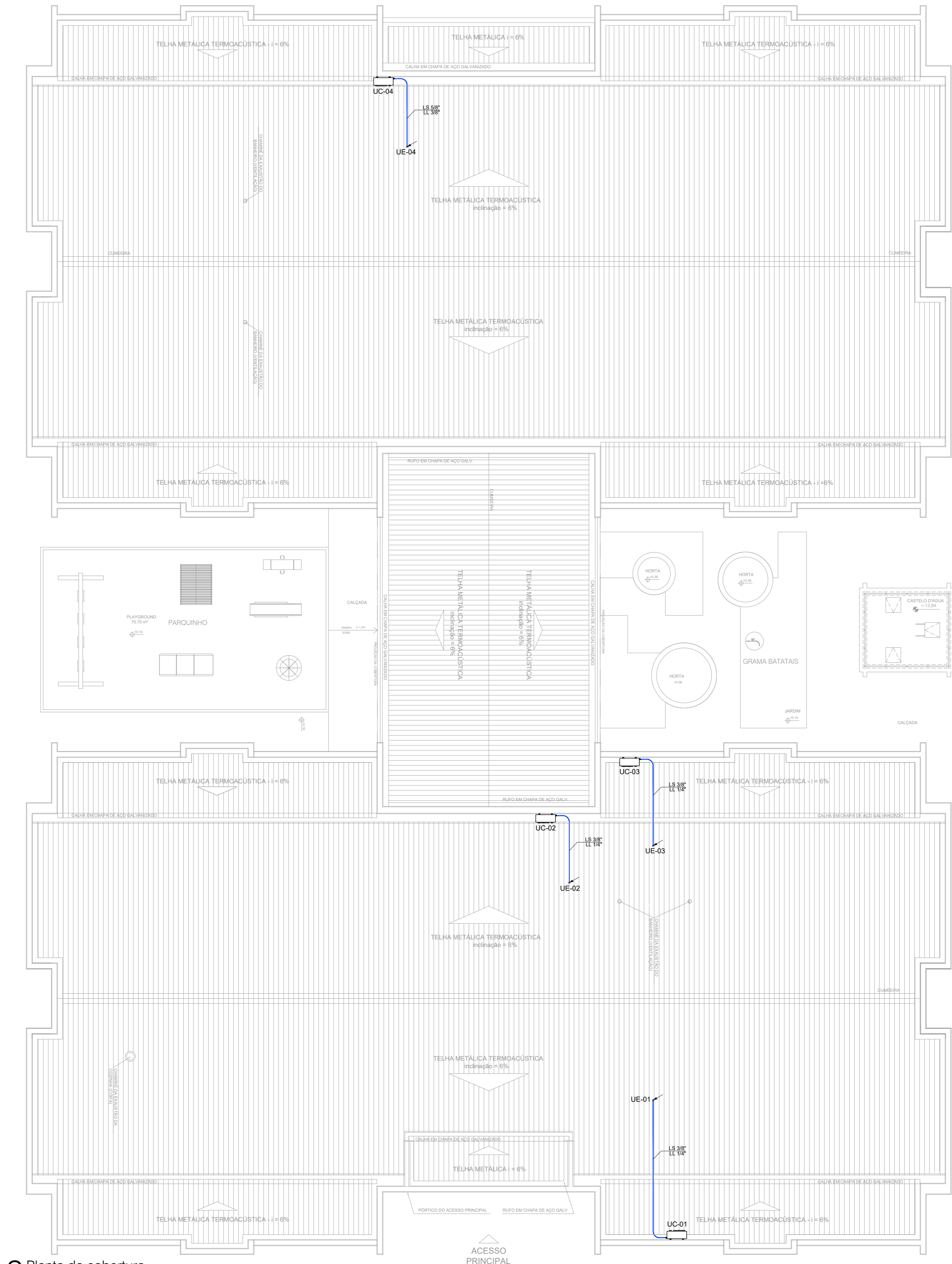
2 Planta da cobertura ESC. 1/100